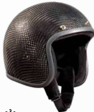
Jet Carbon ohne ECE 590 g