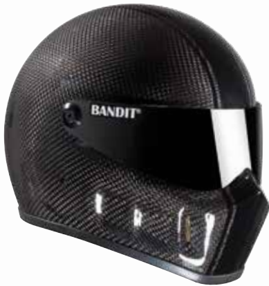
Super Street Carbon 890 g