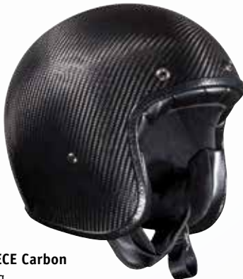
Jet ECE Carbon 850 g