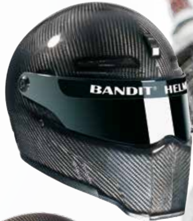
Alien II Carbon ECE 1.100 g