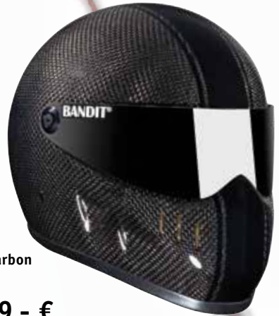
XXR Carbon 890 g