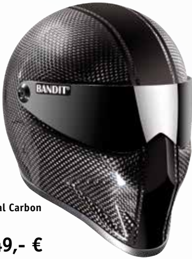
Crystal Carbon 890 g

Fast alle unsere Helme gibt es mittlerweile mit einer Helmschale aus echt Carbon. Die Helme mit Carbonschale sind super leicht.